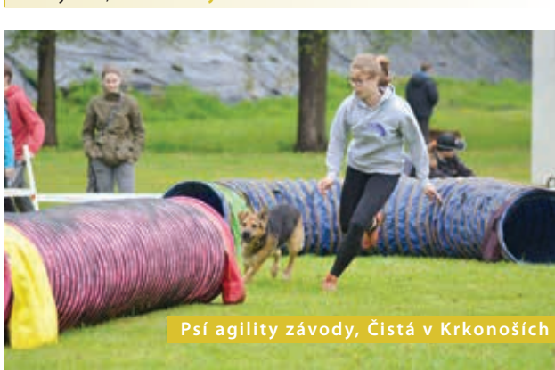
Pší agility závody, Čistá v Krkonoších

Tradiční slavnost. Černý Důl, www.cernydul.cz