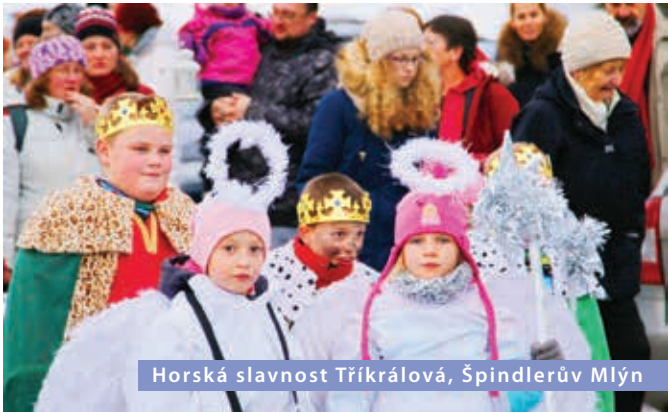
Horská slavnost Tříkrálová, Špindlerův Mlýn

Závod horských nosičů. Pec pod Sněžkou, www.postovnasnezka.cz/snezka-sherpa-cup