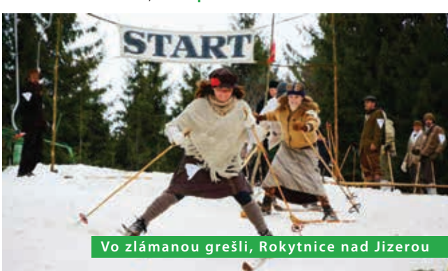
Vo zlamanou grešli, Rokytnice nad Jizerou

Kombinace 2 sportů – obří slalom a parašutistická disciplína s přesností přistání. Vrchlabí-Herlíkovice, www.paraski.cz