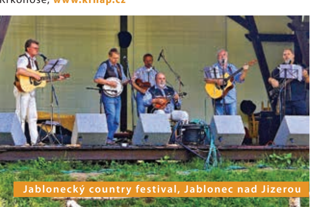
Jablonecký country festival, Jablonec nad Jizerou

Exkurze pro širokou veřejnost zaměřená na skály a kamení atd. Krkonoše, www.krnapp.cz