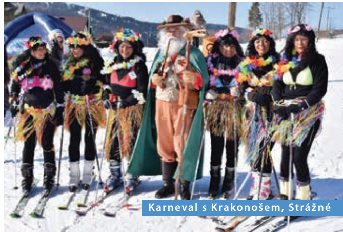
Karneval s Krakonošem, Strážné

Závod v obřím slalomu pro veřejnost, přihlásit se může kdokoli. Špindlerův Mlýn, Svatý Petr, www.skiareal.cz