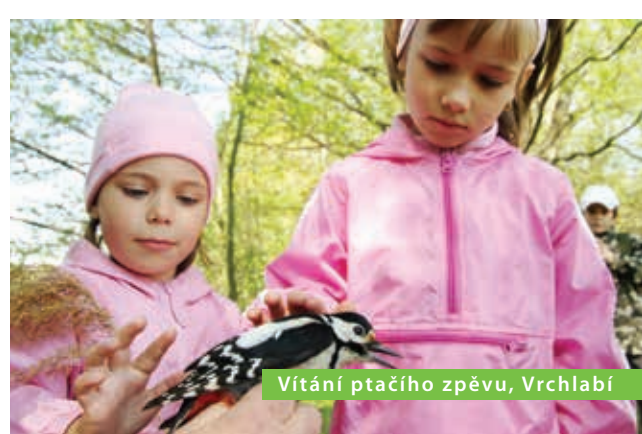
Vítání ptačího zpěvu, Vrchlabí

Rej velikonočních masek, chůdařů, akrobatů a bohatá pomlázka v centru města. Víkend nabitý společenskou zábavou a sportovními zážitky pro širokou veřejnost. Špindlerův Mlýn, www.mestospindleruvmlyn.cz