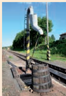
↳ Martinice v Krk.