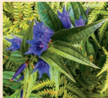
↳ Hořec tolitovitý

Zajímavost: Při mimořádných kulturních akcích jako jsou Jilemnické podvečery (červenec) a Andělské jízdy (prosinec) se vydávají na trať speciální historické vlaky.