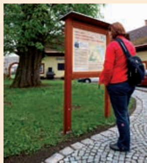
↳ Horní Branná