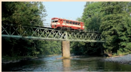
↳ Horní Sytová

Regionální železniční trať s označením 042 ve směru Martinice v Krkonoších > Jilemnice > Hrabačov > Vichová nad Jizerou > Horní Sytová > Poniklá > Poniklá, zastávka > Jablonec nad Jizerou, Hradsko > Jablonec nad Jizerou > Rokytnice nad Jizerou. Hlavním iniciátorem stavby lokálky byl známý krkonošský politik, mecenáš a podnikatel Jan hrabě Harrach. S výstavbou se započalo 10. října 1898 a ke slavnostnímu zahájení provozu na 20 km dlouhé trati došlo 7. prosince 1899.