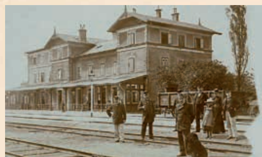
↳ Železniční stanice Martinice v Krk. rok 1900