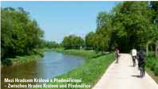
Mezi Hradcem Králové a Předměřicemi – Zwischen Hradec Králové und Předměřice

Nach Vrchlabí fahren wir mit dem Radbus, der 7.05 Uhr aus Hradec Králové abfährt. Hier angekommen, empfiehlt es sich unbedingt, den neuen Klostergarten mit geologischer, pomologischer und botanischer Ausstellung zu besuchen. Nach eingehender Besichtigung fahren wir zum Bahnhof, wo der Elberadweg Nr. 2 beginnt, der uns immer am romantischen Elbufer entlang, zurück nach Hradec Králové geleitet. An der Strecke gibt es zahlreiche Sehenswürdigkeiten und Highlights zu sehen – die Talsperre Königreichswald/Les Království an der Elbe, der ZOO Dvůr Králové mit der größten Kollektion afrikanischer Tiere in ganz Europa, die Barockanlage Kukus/Kuks oder auch die historische Festungsanlage Josefov in Jaroměř. Aus Kuks führt der neu erbaute Elberadweg über Smiřice nach Hradec Králové zurück. Aus Kuks kann man aber auch mit dem Radbus zurück nach Vrchlabí fahren: Abfahrt 17.05 Uhr.