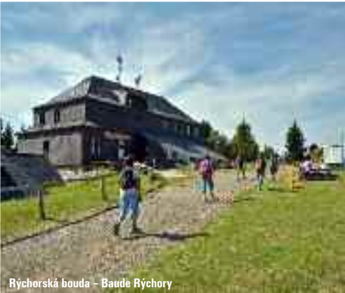
Rýchorská bouda – Baude Rýchory

Z Horní Malé Úpy se po cyklostezce KRNAP č. 24 vydáme do Dolní Malé Úpy. U kostela odbočíme vlevo na cyklotrasu č. 1A a budeme stoupat na Cestník. Tato trasa je známá jako cesta bratří Čapků. Kolem Lysečinské boudy a přes Horní Albeřice nás dovede k Rýchorskému křížu, kde pokračujeme na Rozcestí Kutná a k Rýchorské boudě. Zde se můžeme občerstvit a pokochat se krásným výhledem. Po cyklotrase č. 26 se vydáme jižním směrem přes Rýchory, objíždíme staré zlaté doly a zastavíme se na Lesní plovárně Sejfy. Po občerstvení pokračujeme do Antonínova Údolí. Zde odbočíme vlevo na cyklotrasu č. 26A a sjedeme do Svobody nad Úpou. Cyklobus směrem do Harrachova odjíždí v 17.41 hod.