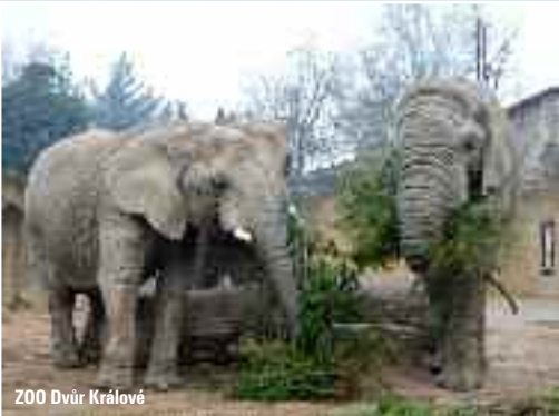
ZOO Dvůr Králové

Do Vrchlabí se dopravíme cyklobusem, odjezd z Hradce Králové v 7.05 hod. Po příjezdu navštívíme novou klášterní zahradu s geologickou, pomologickou a botanickou expozicí. Po prohlídce sjedeme k vlákovému nádraží, kde začíná Labská cyklotrasa č. 2, která nás podél řeky Labe povede zpět až do Hradce Králové. Cestou si můžeme prohlédnout historickou přehradní nádrž Les Království na Labi, navštívit ZOO Dvůr Králové s největší kolekcí afrických zvířat v Evropě, barokní areál Kuks či historický pevnostní areál Josefov v Jaroměři. Z Kuksu vede nově vybudovaná Labská cyklostezka přes Smiřice do Hradce Králové. Z Kuksu můžeme využít cyklobus zpět do Vrchlabí v 17.05 hod.