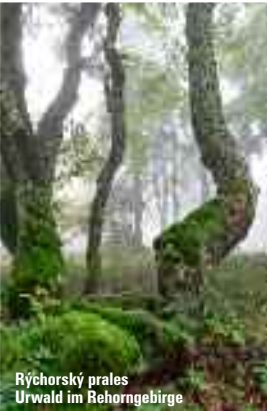
Rýchorský prales Úrwald im Rehornegebirge