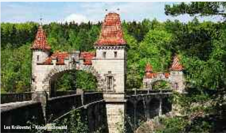
Les Království – Königreichswald

Hradec Králové – Informační centrum Gočárova 1225, 500 02 Hradec Králové Tel.: 495 534 482 icko@ic-hk.cz