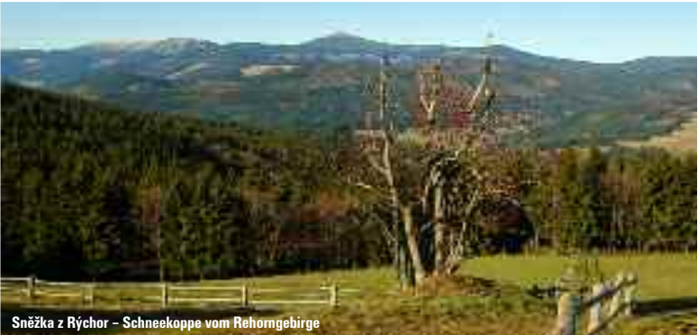
Sněžka z Rýchor – Schneekoppe vom Rehornegebirge

Weitere Ausflugstipps finden Sie in der Sommerausgabe der Tourismuszeitung Riesengebirgssaison , die gratis in allen Informationszentren zu haben ist. Wir empfehlen, sich vor dem Ausflug mit einer ausführlichen und aktuellen Wanderkarte auszustatten!