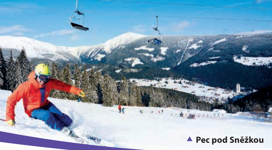
▲ Pec pod Sněžkou