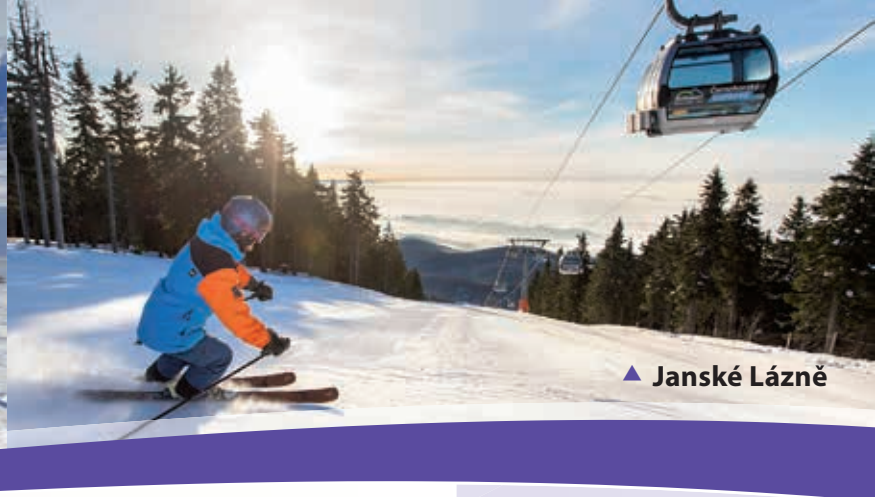
▲ Janské Lázně