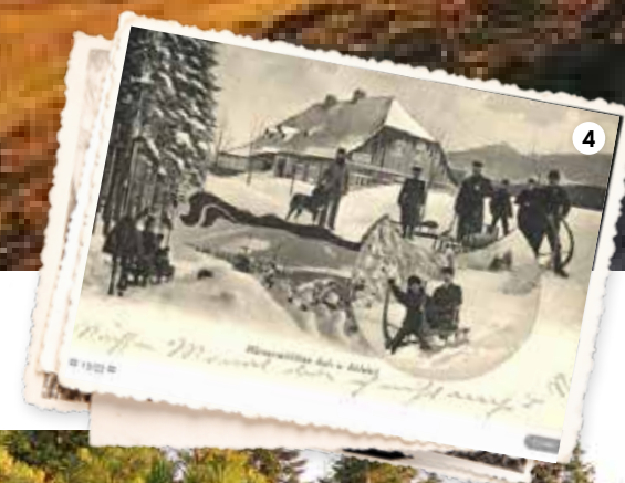
4/ POMEZNÍ BOUDY Už za totality se zde, na strategickém místě Horní Malé Úpy, konaly komunistické sešlosti, které se tu konají dosud. I proto se Disidentská naučná stezka otevírala loni právě tady. 5/ VÝHLEDY Vyjde-li počasí, ze Sněžky jsou vážně dalekosáhlé. 6/ JELENKA Další ze zastávek Disidentské naučné stezky a moc příjemná chata, k níž nelze přijet autem, a tak se v okolí daří mimo jiné i jelenům.