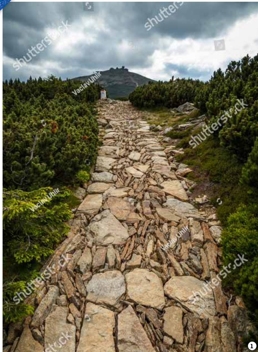
1/ NA VRCHOL Že jste nevstali dost časně, a tak východ Slunce ze Sněžky nestiháte? Nebo záměr hatí oblačnost? Nenechte si vzít radost z volnosti a těšte se na podvečer, krásné jsou tu i západy Slunce 2/ SAMI Tak si Sněžku užijete jen mimo sezonu a hodně brzy ráno.