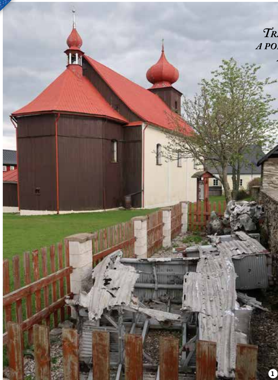
1/ NEBESKÉ NADĚLENÍ Mezi hřbitovem a kostelem v Malé Úpě jsou od r. 1998 soustředěny trosky stroje Ju-52 2/ TETŘÍVEK OBEČNÝ Doma je hlavně ve Skandinávii a na Sibiři, v Krkonoších však bez naší pomoci nepřežije 3/ PIVO HORALŮ Vaří se ve výšce 1045 m.