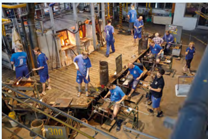
▲ Harrachovská sklárna. ◀ Letitá rozhledna Štěpánka.