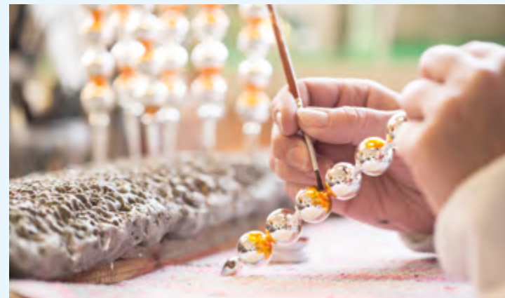
◀ Rodinná firma Rautis se už od roku 1902 věnuje tradičnímu řemeslu foukání skleněných perli a výrobě perličkových vánočních ozdob.

z lávky pod ním. Na jeho úpatí i nad ním jsou k vidění v žule vymleté obří hrnce či čertova oka. Nad těmito přírodními divy se vzhůru do hor vine Mumlavský důl – údolí plné malých vodopádků a kaskád. Údolí je krásné celoročně, ale asi nejlepším časem k jeho návštěvě je časný podzim, kdy se kolem řeky stojící buky zahálí do všech odstínů zelené, žluté a hnědé. S prvními mrazíky buky listy shodí a naplní tak tok Mumlavy žlutohnědou masou milionů listů tekoucích dolů po proudu.