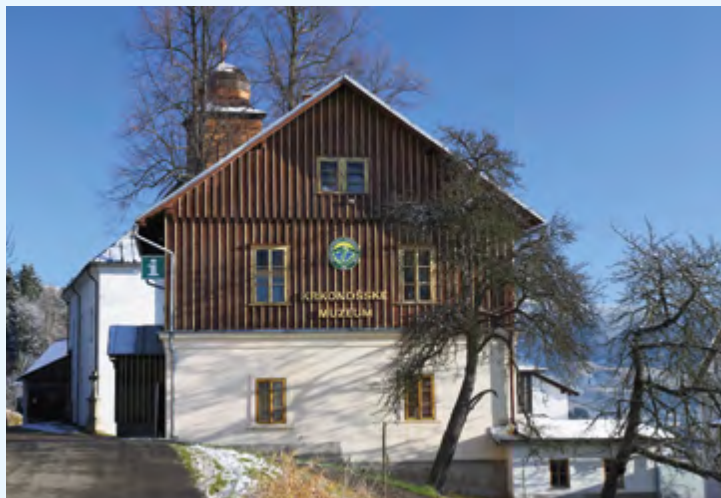
◀ Muzeum v Pasekách nad Jizerou – Památník zapadlých vlastenců.

než 160 lety (roku 1847) knížetem Camillem Rohanem. Název dostala na počest člena císařské rodiny arcivévody Štěpána. Kamenná novogotická rozhledna je 24 m vysoká a z věže je vynikající výhled na západní Krkonoše, údolí Desné a Kamenice. Přimo pod rozhlednou se podařilo v roce 2011 zrekonstruovat kamenný maltézský kříž, který je architektonickým unikátem. Pravděpodobně je to největší kamenný maltézský kříž v ČR. Symbolizuje pietní místo, které tu vybudovali němečtí obyvatelé za 2. světové války na památku padlým vojákům.