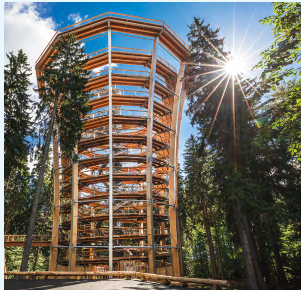
▲ Stezka korunami stromů Krkonoše.

Na Hoffmanových Boudách nad Janskými Lázněmi nedávno přibyla zcela nová atrakce – Stezka korunami stromů Krkonoše. Krásu krkonošských lesů od kořenů až po koruny zdejších majestátních stromů pohodlně, poutavě a bezbariérově ukazuje