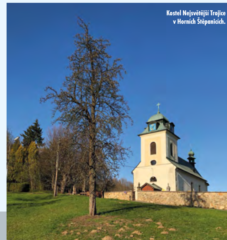
Kostel Nejsvětější Trojice v Horních Štěpanicích.

V roce 1543 se už uvádí jako pustý. Středisko panství bylo přeneseno do Horní Branné a neobnovený hrad se proměnil ve zříceninu. Z mladších osudů hradu můžeme připomenout rok 1821, kdy se po odstřelu zřítíl zbytek kulaté hradní věže. V roce 1992 byla založena Valdštejnova nadace na obnovu štěpanického hradu, od roku 1994 probíhal na hradě archeologický výzkum, během něhož byla v dolní části objevena kovotepecká dílna. K vidění je část obvodové zdi s hranolovou baštou. Hradní kámen místní lidé často využívali při stavbách v okolních vsích.