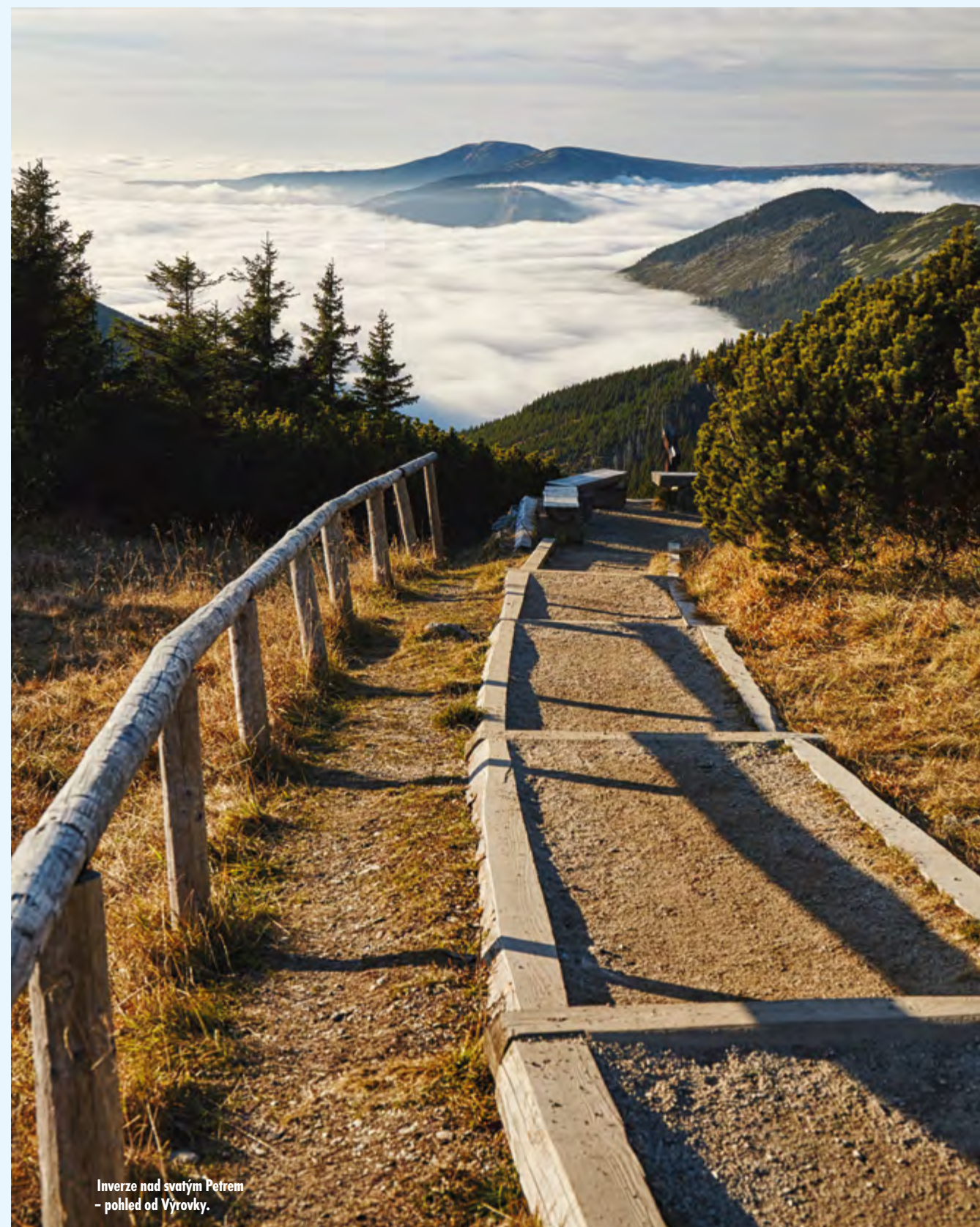
Inverze nad svatým Petrem – pohled od Výrovky.