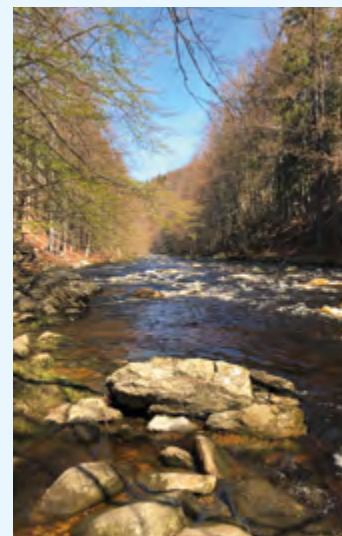
◀ ▶ Řeka Jizera. Její svahy měl hlídat dvojitý bunkr a jeho posádka.