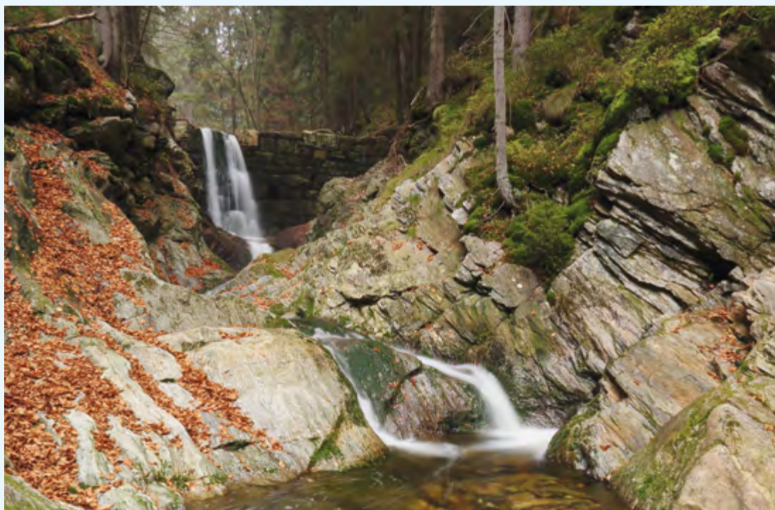
▲ Černohorský potok, jeden z přítoků Úpy.

► Naučná stezka Berghaus seznamuje s dávnou historií dolování v regionu.