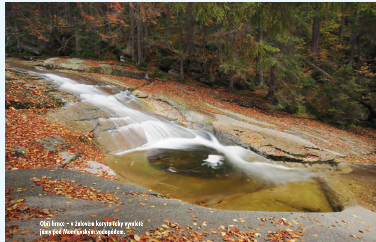
Obří hrnce – v žulovém korytu řeky vymleté jámy pod Mumlavským vodopádem.