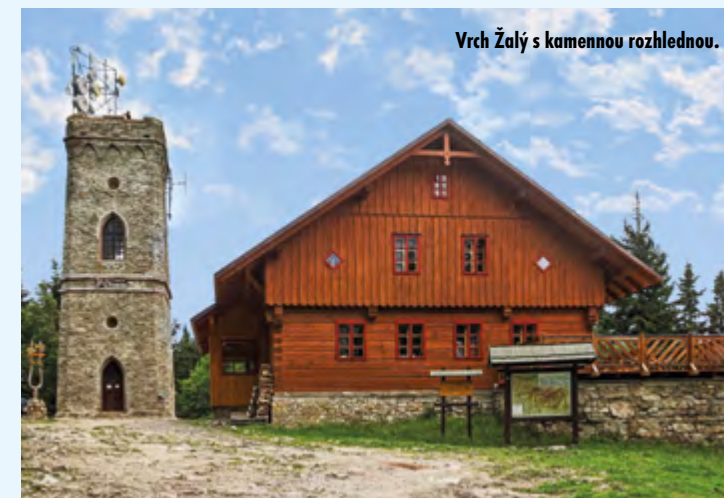
Vrch Žalý s kamennou rozhlednou.

Půjdete-li z Benecka naopak dolů k jihu, přijdete