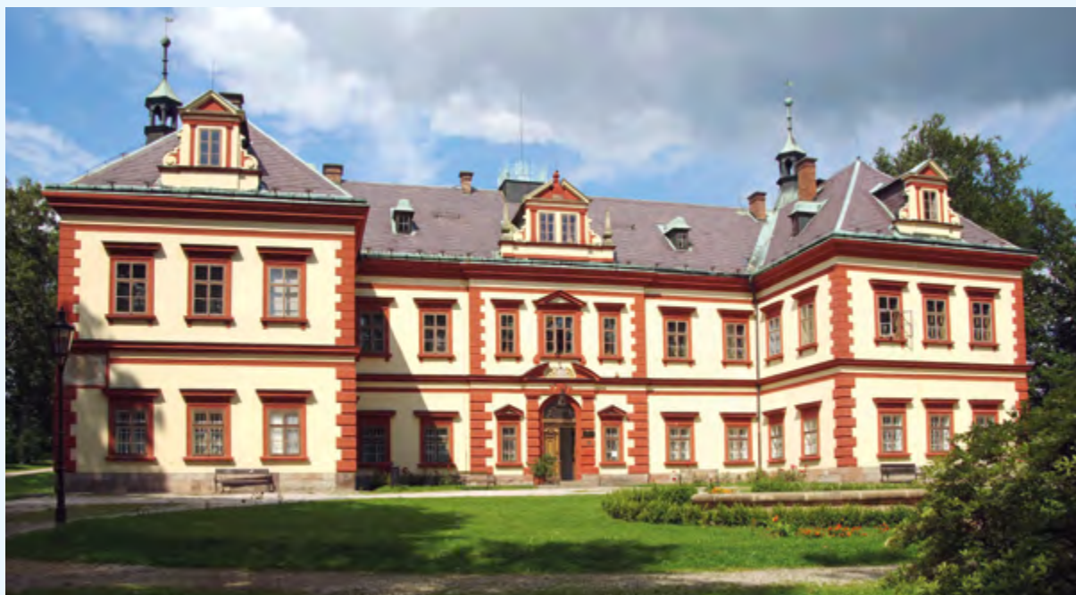
▲► Krkonošské muzeum v Jilemnici a zdejší Zvědavá ulička – ukázka lidové architektury.

ze skleněných perli se zachovala v Poniklé dodnes. Při exkurzi můžete sledovat celou výrobu od ručního foukání perliček přes stříbření a barvení až k samotné montáži ozdoby. Současně si můžete vánoční ozdoby zakoupit nebo sami vyrobit. V nedalekém muzeu uvidíte další tradiční nástroje a nářadí řady krkonošských řemesel, ale také tradiční vybavení domácností, které známe od babiček nebo už jen z vyprávění.