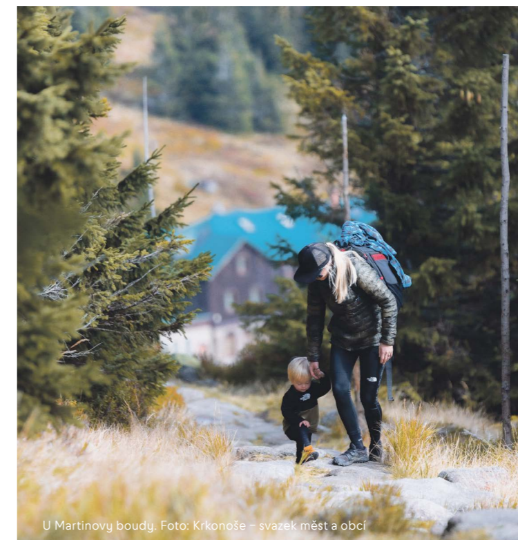
U Martinovy boudy.

Pakliže je historie Krkonoš něčím jedinečná, jsou to osamělé lidské příbytky vysoko v horách – boudy zakládáné samostatně či rozptýleně ve skupinách na lučních enklávách. Některé sloužily původně jako letní salaše. Jiné zakládaly rodiny dřevařů a v každodenním boji s nehostinnou vysokohorskou krajinou hledaly podmínky k živobytí. Od poloviny 18. století se tyto příbytky stávaly celoročními sídly budařů, kteří později objevili i jejich turistický potenciál. I dnes celá řada z nich slouží turistům a návštěvníkům hor. Ač do nich již proudí voda a elektřina, nemyslete si, že je život na hřebenech snadný! Vyžaduje houževnatost a skromnost. Proto je stále mnohdy více srdeční záležitostí než byznysem. Přesvědčte se o tom během vašeho putování.