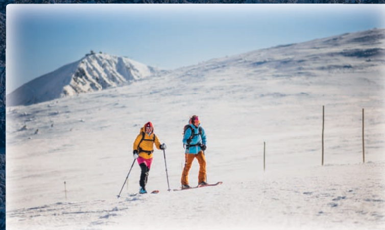
▼ Śnieżka stanowi prawdziwe wyzwanie dla miłośników górskich wędrowek

Tym samym jest najstarszą, ciągle działającą hutą szkła w Europie. Oferuje codziennie zwiedzanie hal produkcyjnych, więc możesz z bliska przyrzeć się pracy hutników.