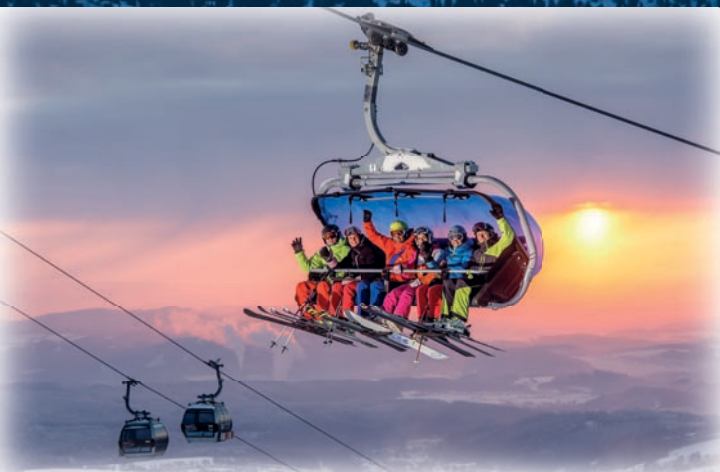
▲ SkiResort ČERNÁ HORA – PEC to największy ośrodek narciarski w Czechach