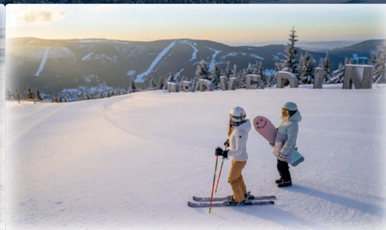
▼ Medvědin to najwyższy szczyt terenu narciarskiego Szpindlerowy Młyn

Ścieżka w koronach drzew Karkonoszy o długości 1,5 tys. m pokaże Ci, co czyni przyrodę tych gór wyjątkową. Poznasz tutejsze piękne lasy dostownie od korzeni po korony, będziesz cieszyć się podnoszącymi emocje niespodziankami i wieloma dociekliwymi pytaniami.